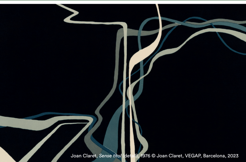
Joan Claret, Sense títol (detall), 1976 © Joan Claret, VEGAP, Barcelona, 2023